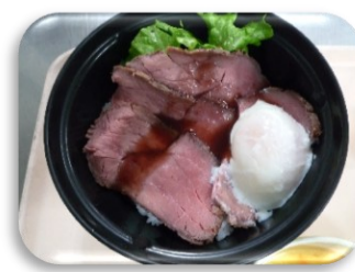
ローストビーフ丼