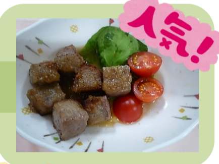
B: サイコロステーキ